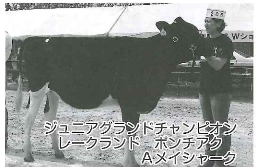
ジュニアグラントチャンピオン レークランド ポンチアク Aメイシヤーク