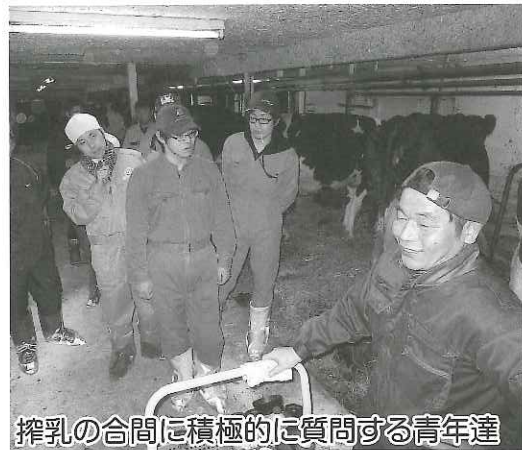
搾乳の合間に積極的に質問する青年達