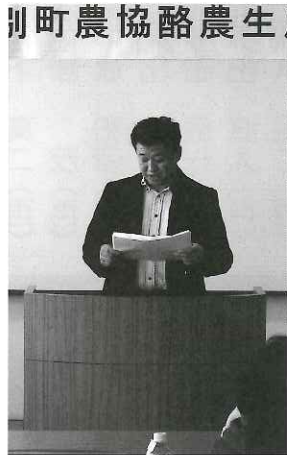
湧別町農協酪農生産部会通常総会