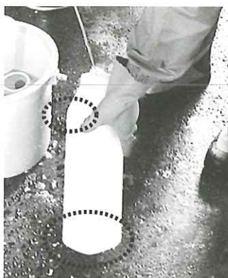
汚れの落ちにくい場所は丁寧に！

ほ乳瓶のかどは汚れが落ちにくいので、丁寧な洗浄が必要です。また、古くなった乳首は劣化したゴムに汚れがたまり雑菌が繁殖します。早めの交換が必要です。