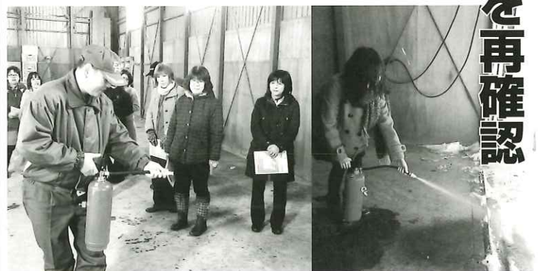
訓練用の消火器を使用し、消火訓練をおこないました。

訓練に参加した農協職員とAコープ社員は、消防職員から消火器の取り扱い方を学んだ後、訓練用の器材を使用した消火器訓練を行い、職員達は消火器の必要性和適切な使い方を学びつつ、火災の恐ろしさを再確認し、充実した消防訓練となりました。