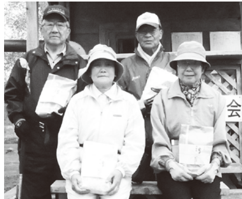
▲最後は上位入賞者の皆さんで記念撮影