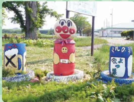
川西地区 『アンパンマン』