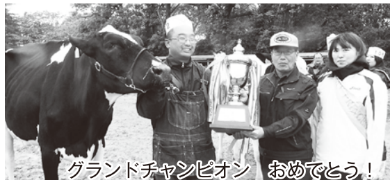
グラントチャンピオン おめでとう!