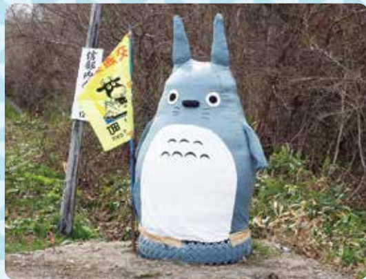
信部内地区 『トトロ』