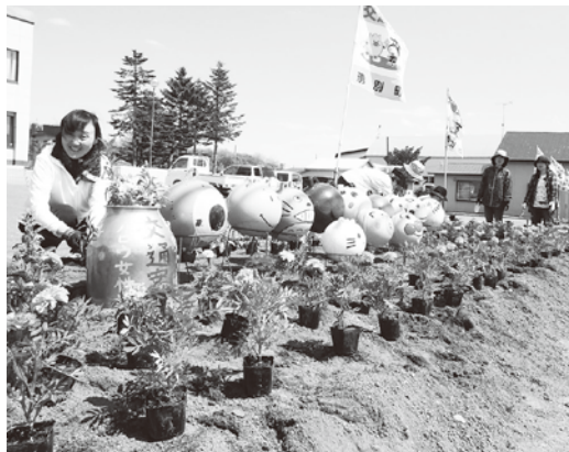
▲花を植えている様子（芭露支所）

湧別町農協女性部は、6月6日に農協本所と支所で花壇整備を行いました。農協にお越しの際は、女性部員たちが一生懸命植えた色鮮やかな花をぜひご覧ください。