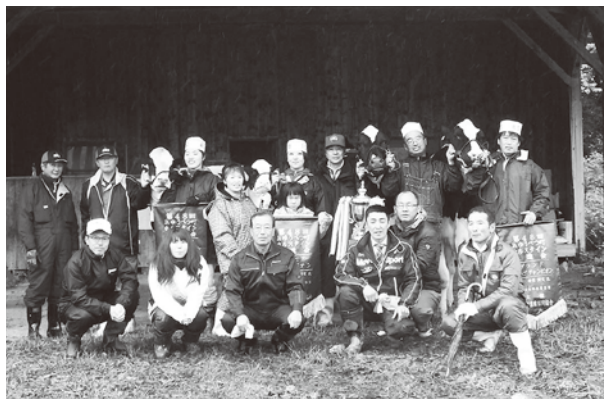
▲入賞牛と一緒に記念撮影

共進会当日は天気にも恵まれず雨の中の審査となり、あまり良いコンディションではなかったものの、リードマン達はチャンピオンを目指すため懸命に牛を引く姿がとても印象的でした。 上位入賞牛は以下の通りです。