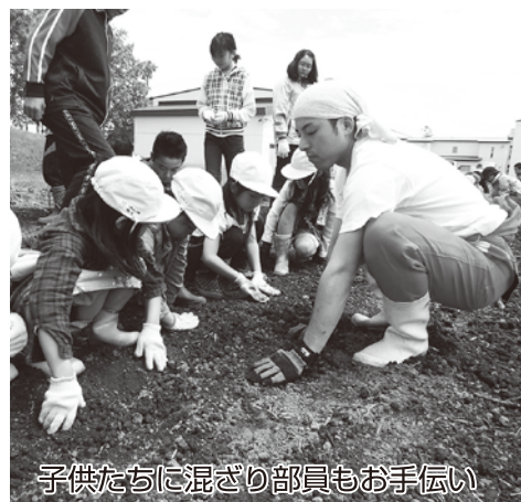
子供たちに混ざり部員もお手伝い

今年も秋に行われる学校行事の「やきいも会」には、子供たちが一生懸命育てたおいしいじゃがいもを食べる事ができるでしょう。今後も、JA ゆうべつ町青年部は食の宝庫である湧別町の農業を通じて、食の安心・安全を地域住民の方々へ伝える活動を行って参ります。