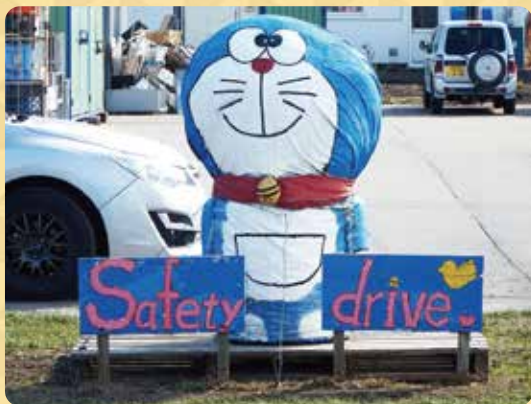
中央地区 『ドラえもん』