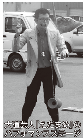
大道芸人『えだまめ』のパフォーマンスステージ