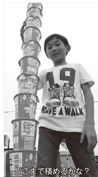
どこまで積めるかな？

また、一分間の間に誰が一番しゃがりこを高く積めるかを競う『お菓子つむつむ大会』や『スイカ割り大会』を開催し、最後は恒例のお菓子まき、もちまき、ビンゴゲーム大会