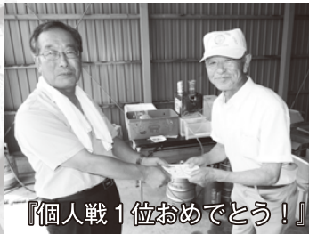
『個人戦1位おめでとう!』

大会会場で熱戦を繰り広げた後は、芭露支所の車庫にて懇親会、成績発表が行われ、会場は大いに盛り上がりました。