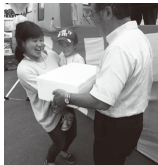
▲小さな男の子がお母さんと一緒にゆうべつ牛の重量を当てました

8月5日、湧別町農協本所駐車場にて「JA ゆうべつ町ふれあいまつり」が今年も開催されました。湧別町農協と一般のお客様とふれあうことで企画されたこのイベントも、「JA ゆうべつ町創業まつり」より名称が変更になってから今年で7回目の開催となりました。