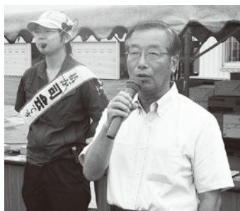
▲友澤組合長より 開催の挨拶

で締めくくり、無事ふれあいまつりを終了することができました。 なお、よつ葉乳業(株)の協賛による乳製品の売上につきましては、湧別町社会福祉協議会を通し熊本震災の義援金として寄付させて頂きました事を報告致します。たくさんのご協力ありがとうございました。