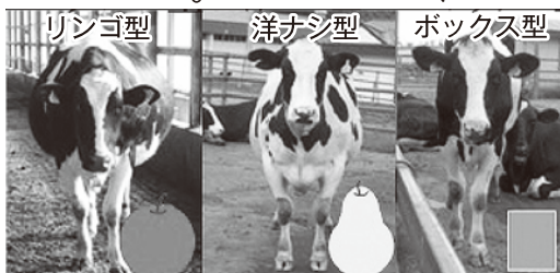
お腹いっぱいしっかり食い込めている 小食で痩せている

乾乳期は、自家にある良質な粗飼料を給与し、飼槽を空にしないことが重要です。また、乾乳牛を観察し、十分に採食できていないか確認する必要があります。写真のようなリンゴ型の腹づくりを目指しましょう。