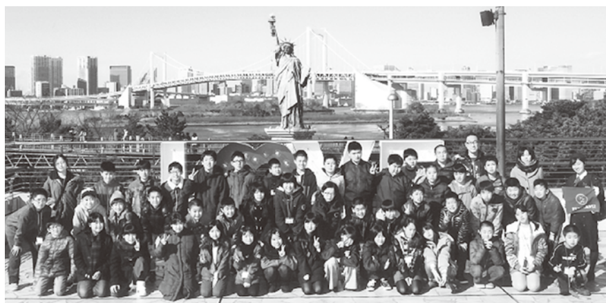
▲お台場の自由の女神像の前で記念撮影

また、この定期積金を利用した「ちびっ子体験旅行」は平成32年1月にも計画をしております。今年の秋頃に積立のご案内を致しますので、ぜひたくさんさんの参加をお待ちしております。