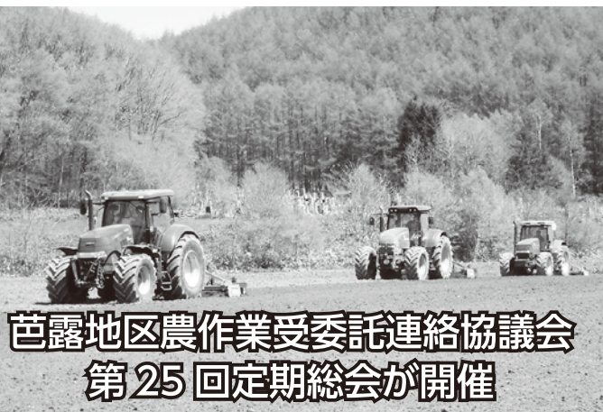
芭露地区農作業受委託連絡協議会 第25回定期総会が開催

芭露地区農作業受委託連絡協議会は、3月13日に湧別町農協芭露支所にて第25回定期総会を開催致しました。