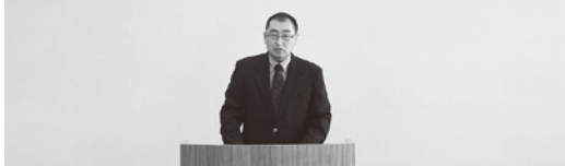
総会 株主定時ばろうサポートアグリ(有)

今年度の事業方針については計画的な草地更新と畜産クラスター事業でトラクター・スプレーヤーセットを導入し除草剤散布の効率化を進めると共に、圧縮梱包のみでの製造の限界と製造及び配送時間短縮の為、バラ飼料の製造計画を樹立し、2020年秋に実施できるといふ検討するという計画で総会を閉会しました。