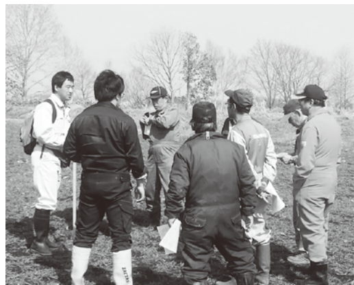
▲圃場現地調査の様子

『近年では最も良好に感じられることから、今後の施肥管理が重要となり、特に茎数が2,000本を超える圃場については、葉の色、立ち方等を見ながら、肥料の必要量について検討していく必要があるように感じました』と、意見を頂きました。