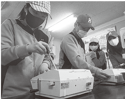
▲検査機器を実際に操作する生徒達

芭露学園の7年生(中学1年生)が社会見学の一環で小麦乾燥貯蔵施設を訪問し、湧別産の小麦と麦工場との関係について学びました。この工場はJAゆうべつ町地区の生産者が作付けする小麦を乾燥調製し貯蔵する施設であり、調整した小麦はホクレンを通じて全国に流通していることや、特に北海道産の小麦粉は品質も良く、誰もが食べたことのある有名なお菓子や高級なうどん等に使われていることを説明すると生徒たちは驚いていました。