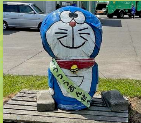
中央地区：ドラえもん