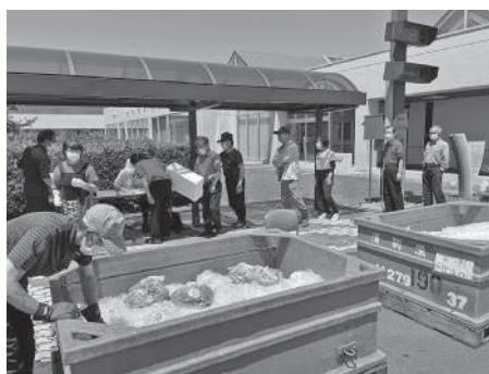
▲ホタテとバターの無料配布