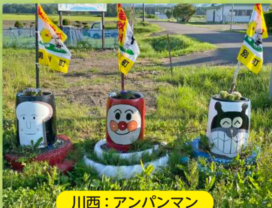
川西：アンパンマン

農協女性部 交通安全がかし紹介 JAゆうべつ町女性部が作成した交通安全を喚起するかし達を紹介します。