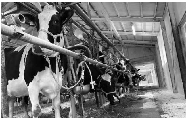
▲牛移動後の牛舎の様子