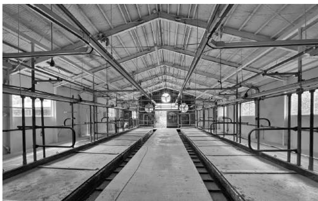
▲牛移動前の牛舎内部