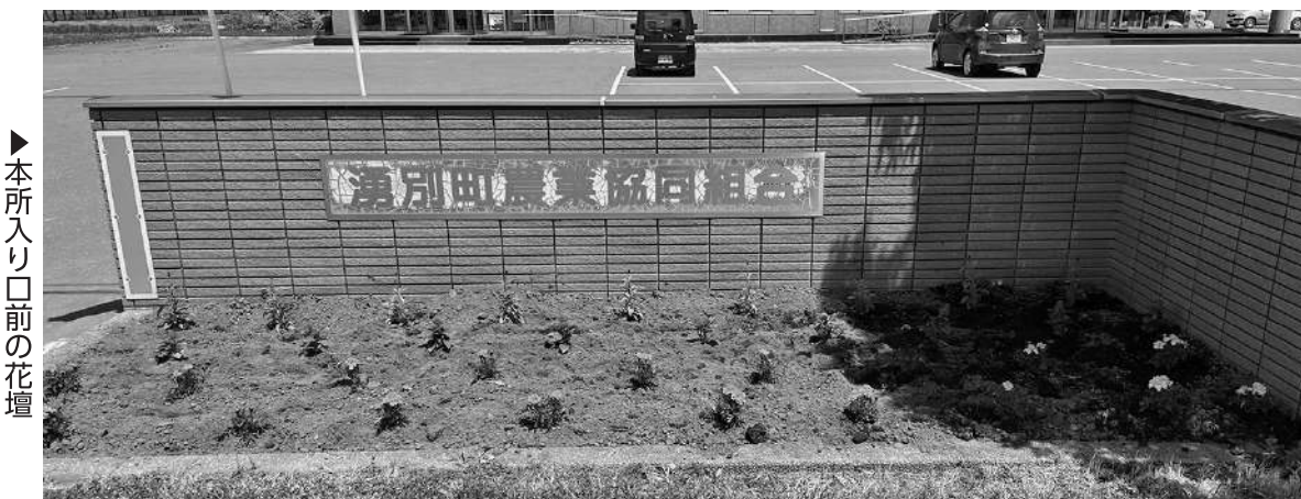
▶本所入り口前の花壇