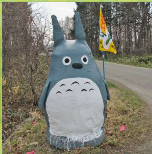
信部内地区：トトロ