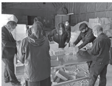
▲配布の準備をする農協役職員と町職員

6月23日に各自治会のご協力により、乳製品消費拡大運動として湧別漁協のホタテの無料配布と合わせて、全町民にバター(150g×2)を無料配布しました。