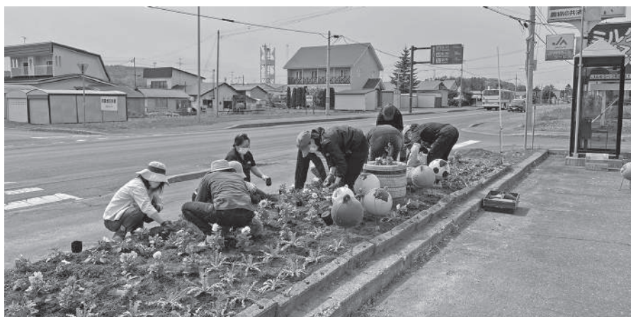
▲花を植えている様子

J A ゆうべつ 町女性部は、湧別町農協本所と支所で花壇整備を行いました。農協にお越しの際は、女性部員たちが一生懸命植えた色鮮やかな花を是非ご覧ください。