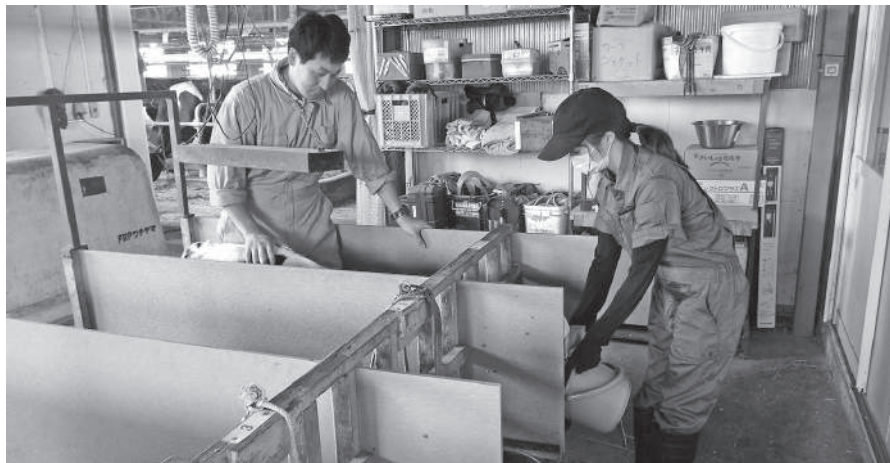
▶子牛にミルクをあげている様子

2年後の就農に向けて今後も皆さんにご支援いただきながら研修を行っていくので宜しくお願いします。