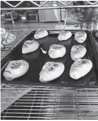
▲焼きあがったパン