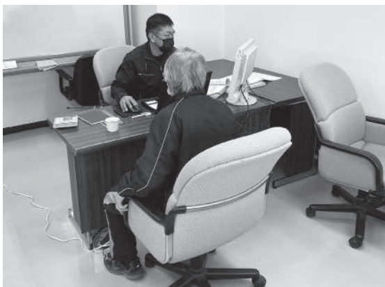
▲宮農計画書作成の様子

宮農計画協議では、組合員の皆様で作成した宮農計画書をもとに職員が経営分析し、本年の収支に反映・改善を目的として行われています。一年間の宮農に向け、各担当職員と真剣な面持ちで協議が行われました。 皆様方の計画を上回る年を迎えることができますよう、ご祈念致します。