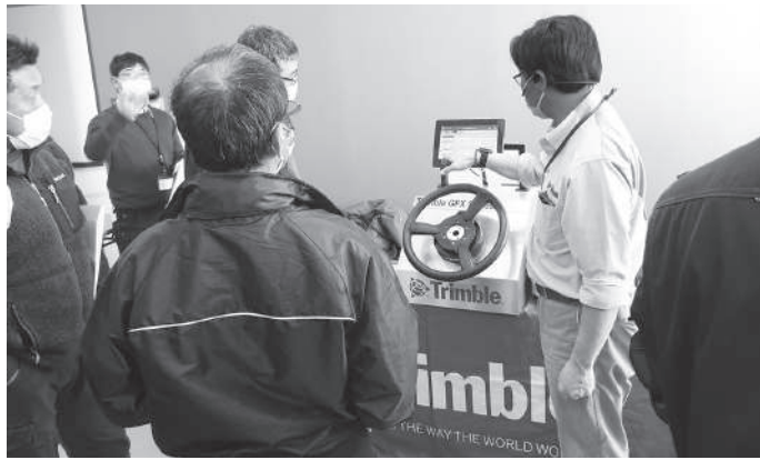
▲デモ機を前に説明を受ける参加者

説明会終了後は会場に設置頂いた自動操舵ガイダンスシステムのデモ機を前にして、実際のシステムの挙動や操作方法等を参加者が各メーカー担当と確認していました。