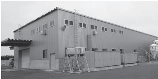
▲JA けねべつ TMR センターアクセス（上） （株）鹿追町第2TMRセンター（下）

でも作業が可能となっており、人員不足等が懸念される昨今、画期的なシステムでありました。日曜日の飼料配送が完全休業としており職員が働きやすい環境も特徴的と感じました。