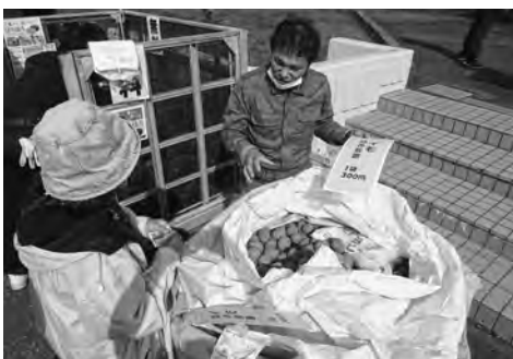
じゃがいもの袋詰め放題

毎回恒例のイベントでは、じゃんけん大会、ゆうべつ牛肉の重量当てではピタリ賞が2名、お菓子つむつむ大会・カップ麺積み大会には、多くの方々の参加があり大いに収穫祭を盛り上げて頂きました。ホクレン芭露給油所からはスタッドレスタイヤ・ストープの展示、キッチンカーなどが加わり、最後はちびっ子・大人もちまき、ビンゴゲーム大会で締めくくり無事収穫祭を終了することが出来ました。