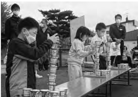
じゃがりこつむつむ大会