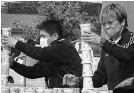
カップ麺つむつむ大会