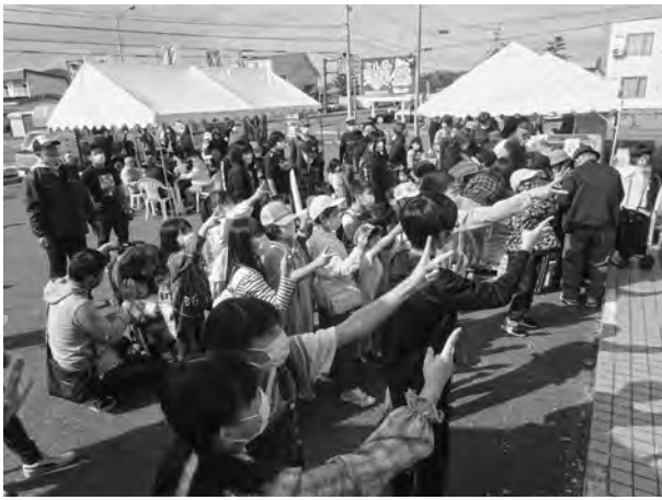
じゃんけん大会の様子

当日は雨降りが心配された中で開催でしたが、天候にも恵まれ、じゃがいもの袋詰め放題、モツ鍋、牛肉販売、乳製品販売、女性部によるうどん・そばの販売もあり会場は多くの来場者で賑わいました。