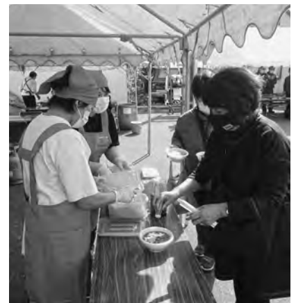
女性部：うどん・そば販売