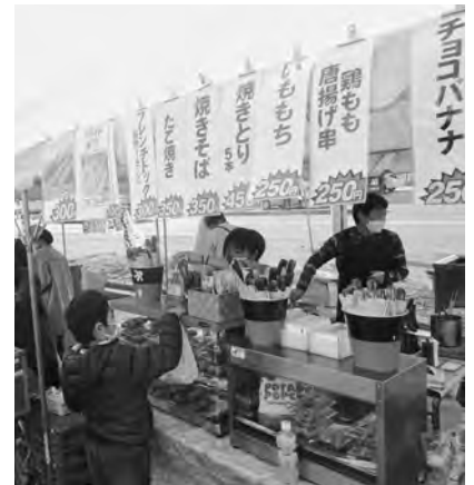
(株)Aコープゆうべつ出店