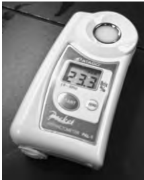
写真 デジタル糖度計