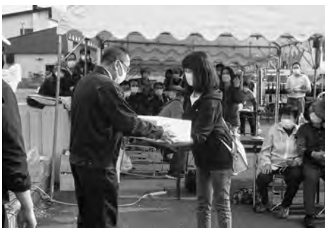
重量当てピタリ賞！おめでとう！