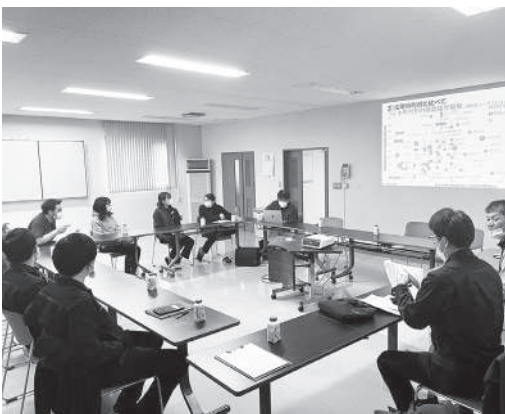
▲勉強交流会の様子

飼料高騰が続く中において、粗飼料が農業収支にどれほど影響を与えるか、実際のデータを見せさせていただきました。今後の営農指導に役立てていきたいと思っております。今後も、NOSA I との勉強交流会を予定し、営農指導力を高めたいと思います。