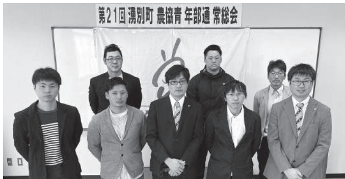
新役員 of 皆さん