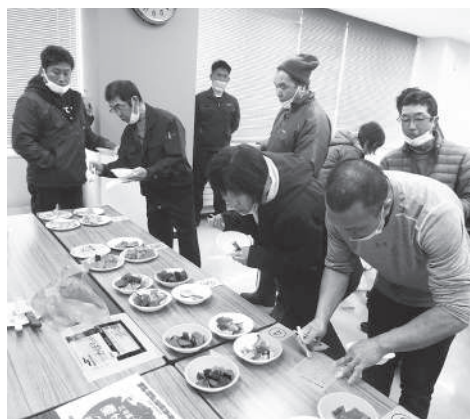
南瓜当てクイズの様子 湧別産はどれ！？

会議終了後、南瓜当てクイズをしました。湧別産はどれか、甘みがあるのはどれか、参加者全員で挑み、南瓜を口に含み各々意見が飛び交いました。実際に味見をして湧別産の南瓜の旨味を感じ取ることができました。