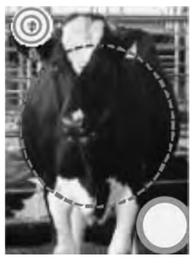
スコア3 リンゴ型 前から見るとルーメンが十分に張り、飼料の喰い込みが良好と判断。