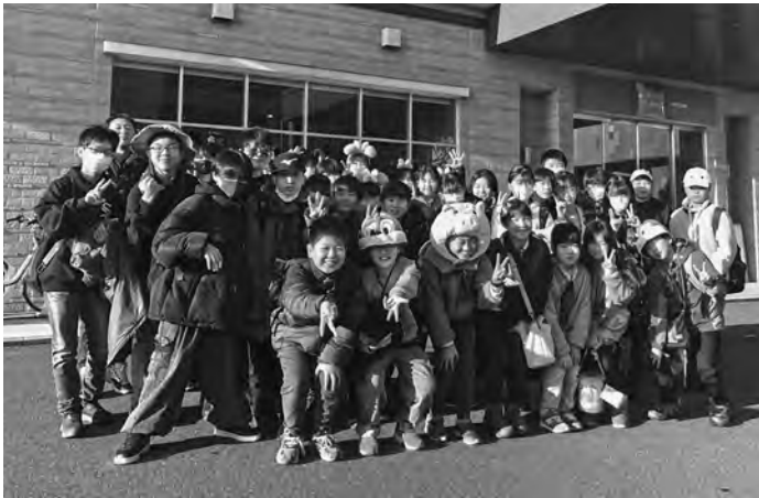
▼笑顔たくさん記念撮影

も大騒ぎとなりましたが、子供たちにとっては、思い出に残る「体験旅行」になったと思います。