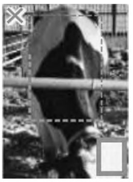
スコア1 ボックス型 前から見るとルーメンが張っておらず、四角く箱のように見える。飼料を喰い込めておらず栄養不足。