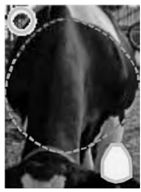
スコア2 洋ナシ型 前から見るとルーメンが張り、適度に採食していると判断。